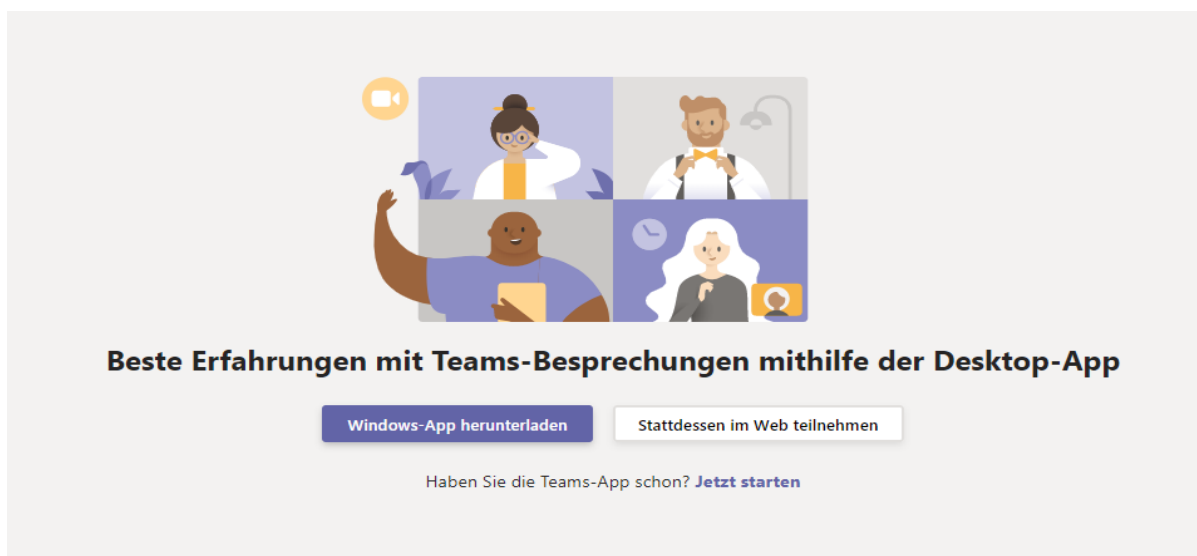
Abbildung 2: Beitritt zur Konferenz

Unter Windows ist dies für den integrierten Browser „Microsoft Edge“ gegeben. Sollten Sie standardmäßig einen anderen Browser verwenden, kopieren sie bitte den Link aus der E-Mail und öffnen ihn in MS Edge.